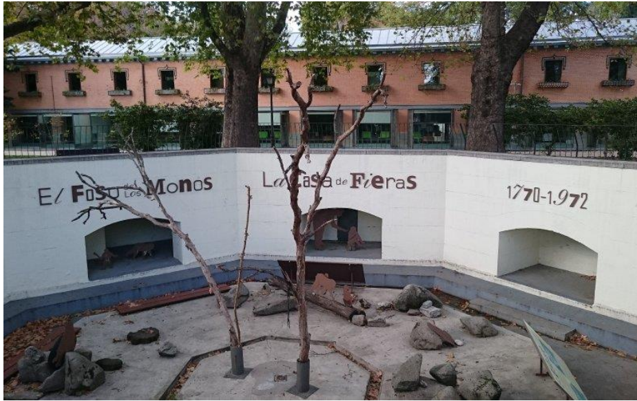
Ancien Zoo du Retiro, Madrid.

Près du télégraphe optique, il y avait une scène intéressante. Pendant les années où le Zoo était ouvert au public, les éléphants avaient l'habitude de se baigner dans un étang situé à côté du télégraphe. Il était courant de les trouver en train de barboter sur le chemin du télégraphe.