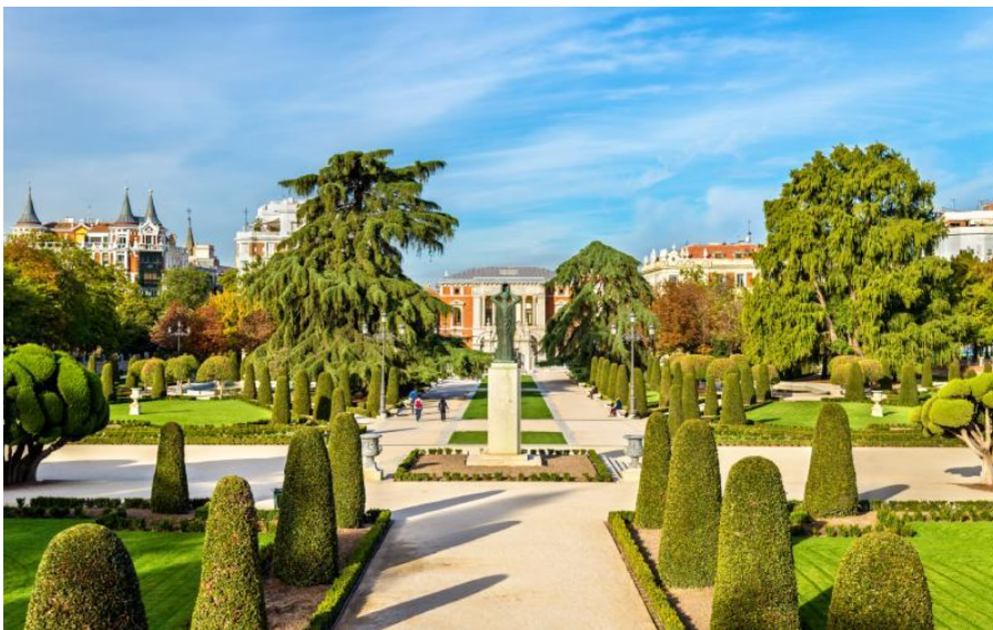
Jardins du Parterre.