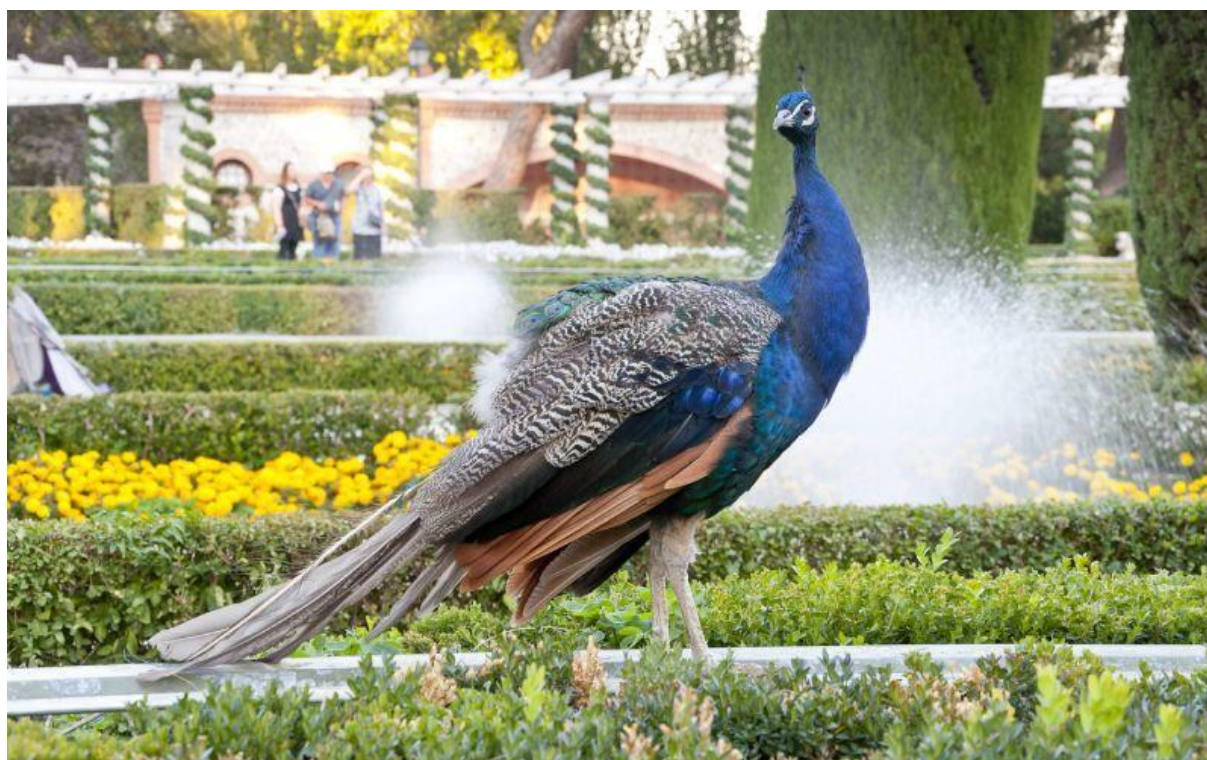
Paon dans les jardins.

Il existe un univers différent à El Retiro qui est situé très près du Palais de Cristal. Un qui semble vibrer d'un air totalement différent des autres. Les jardins de Cecilio Rodríguez ne sont pas connus de tous. À première vue, ces magnifiques jardins semblent sortir d'un conte. Chaque détail, chaque vigne, chaque rose semble avoir été placé avec le plus grand soin.