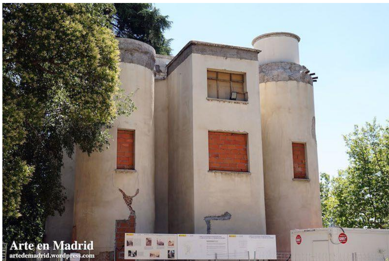
Télégraphe optique.

Qui aurait pensé que le Retiro aurait son propre télégraphe ? En fait, il est connu comme le Petit château du Retiro. Construit en 1850 près de l'ancien Zoo du parc, ce curieux bâtiment a connu diverses utilisations au cours de l'histoire. Au début, il servait de lien entre les lignes télégraphiques de Castille, de Valence et d'Andalousie. Plus tard, il est devenu une école de télégraphie électrique et, enfin, le siège de l'Institut central de météorologie, mieux connu aujourd'hui sous le nom d'AEMET.