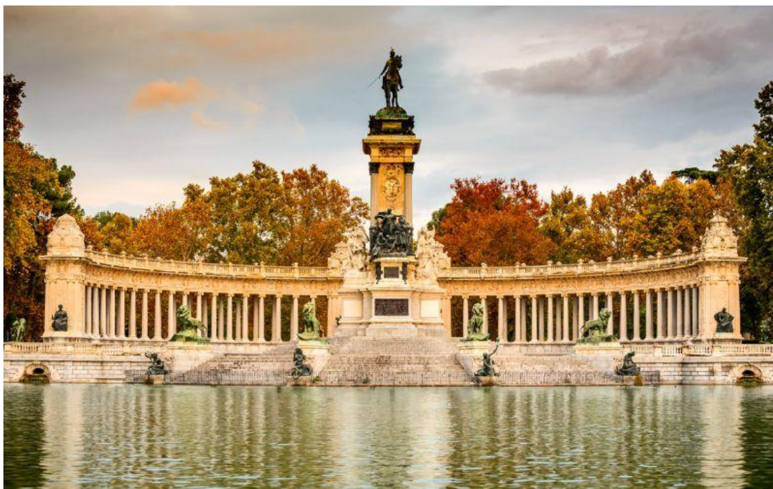
Parc El Retiro.

Se promener dans ces jardins est l'un de ces plans essentiels dans l'agenda culturel de tout Madrilène ou touriste. Les grands espaces verts sont le cadre idéal pour profiter d'un après-midi agréable en lisant un livre. Si vous vous sentez l'âme d'un explorateur, vous aurez probablement envie de connaître en détail l'impressionnant Palais de Cristal, la roseraie ou la statue de l'ange déchu. Ce que tout le monde ne sait pas, ce sont certains des lieux cachés du Retiro, des endroits quelque peu secrets qui deviennent de véritables trésors à découvrir.