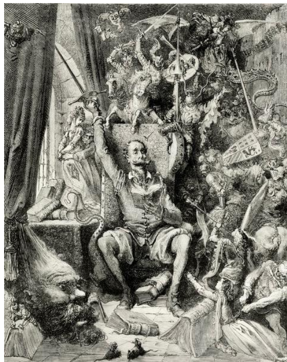
Don Quichotte dans sa bibliothèque (Gustave Doré 1863)

Au 20e siècle il fut rangé dans la catégorie des classiques littéraires, et considéré comme un chef-d'œuvre précurseur.